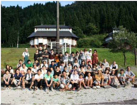
上畠アート展のスタッフ全員で記念撮影。暑い中お疲れ様でした！

「利賀ゼミ」は都会に住んでいながら、利賀村に通い活動する人たちのネットワークです。メンバーは一年を通して、村に通いながら、村の生活に学び、それぞれの関心に基づくプロジェクト