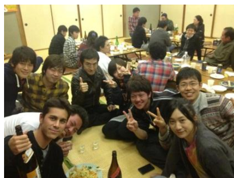
美味しいごはんとお酒に舌鼓を打つみなさん、出来上がってますね!?

最後に多くの方々のご協力があったこのイベントを開催できたことに、改めて感謝致します。食材を提供して頂いた皆様、