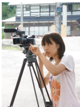
劇団サークル所属のメンバーによる撮影。利賀からも出演多数!

自主映画「サマー・ラブロック」撮影(2012年9月2日〜4日)・・・慶應義塾大学の仲間、利賀村の方々を中心に、オリジナル脚本で映画を撮影しました。