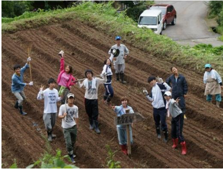
開墾系大学生、耕作放棄地ヲオコス。今年ハ赤カブラ収穫。