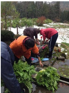
採れたての野菜を洗う 水が冷たいー!!

村のよさとか悪さとか、まだ正直よくわからない。けど僕はいま、一人でも多くの方に出会って、話を聞きたい。一人一人にとつての「利賀村」をその人の言葉で聞きたいのです。その中に本当のよさとか現実があると思う。多くの都会人を利賀に連れてきたい。そして、村の人や都会の人と一緒に何かしたい。そこで料理が好きな僕は今回ごはん会を企画した。会場は利賀ゼミ生も村の人もなく、にぎやかな雰囲気、身内の集いのような、なんともいえない温かな